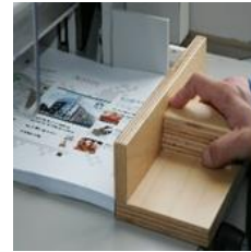
Druck- und Kopierservice