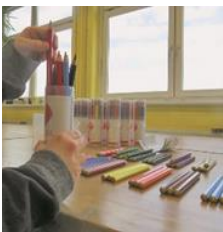
Konfektionierung / Verpackung