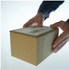
Botendienste / Postversand